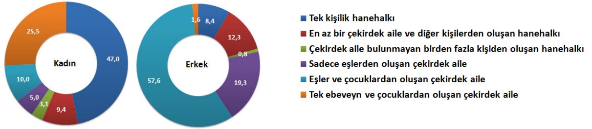
Hanehalkı sorumlusunun cinsiyetine göre hanehalkı tipi, (%), 2018

Türkiye'deki hanelerin %48,3'ü eşler ve çocuklardan oluşan çekirdek ailelerden, %16,5'i sadece eşlerden oluşan çekirdek ailelerden, %15,9'u tek kişilik hanelerden oluştu. En az bir çekirdek aile ve diğer kişilerden oluşan hanehalklarının oranı %11,7 olurken, tek ebeveyn ve çocuklardan oluşan çekirdek ailelerin oranı %6,3, çekirdek aile bulunmayan birden fazla kişiden oluşan hanehalklarının oranı ise %1,3 oldu. Hanehalkı sorumlusu erkek olan hanelerin %57,6'sı eşler ve çocuklardan oluşan çekirdek ailelerden, hanehalkı sorumlusu kadın olan hanelerin %47'si tek kişilik hanelerden oluştu.