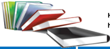
Hanehalkı sorumlusunun eğitim durumuna göre tüketim harcamalarının dağılımı (%), 2016

Hanehalkı sorumlusunun eğitim durumuna göre hanelerin tüketim harcamalarının dağılımı incelendiğinde, eğitim düzeyine göre harcama kalıplarının değiştiği görüldü. Eğitim düzeyi arttıkça ulaşıtırma, eğitim, eğlence ve kültür, lokanta ve otel harcamalarına ayrılan pay artarken, gıda ve alkolsüz içecekler, konut ve kira gibi zorunlu harcamaların payı azaldı.